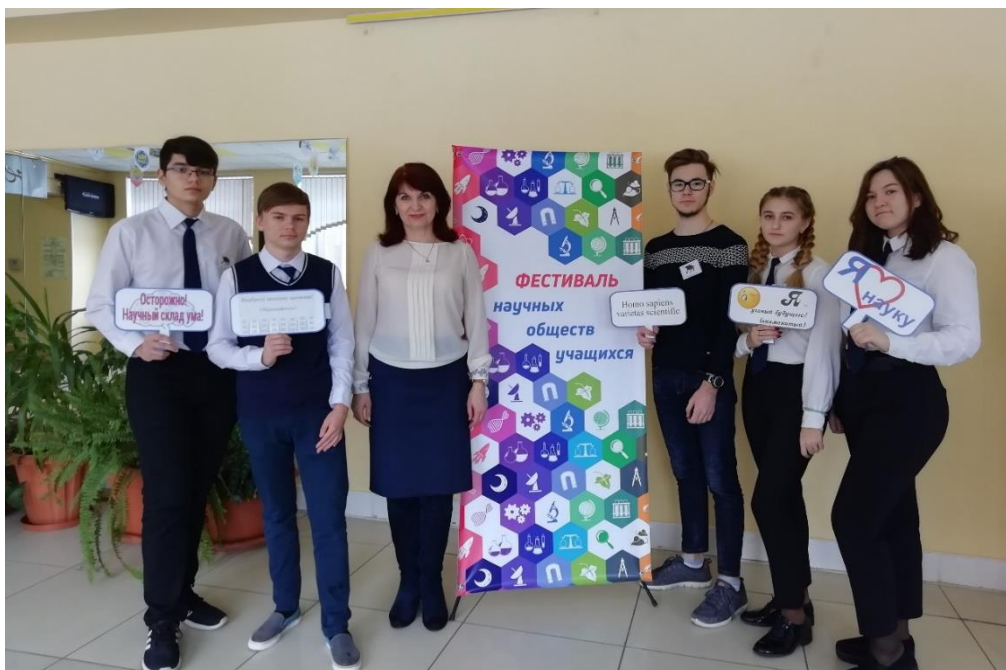
Команда МБОУ «СОШ №24» на городском фестивале НОУ